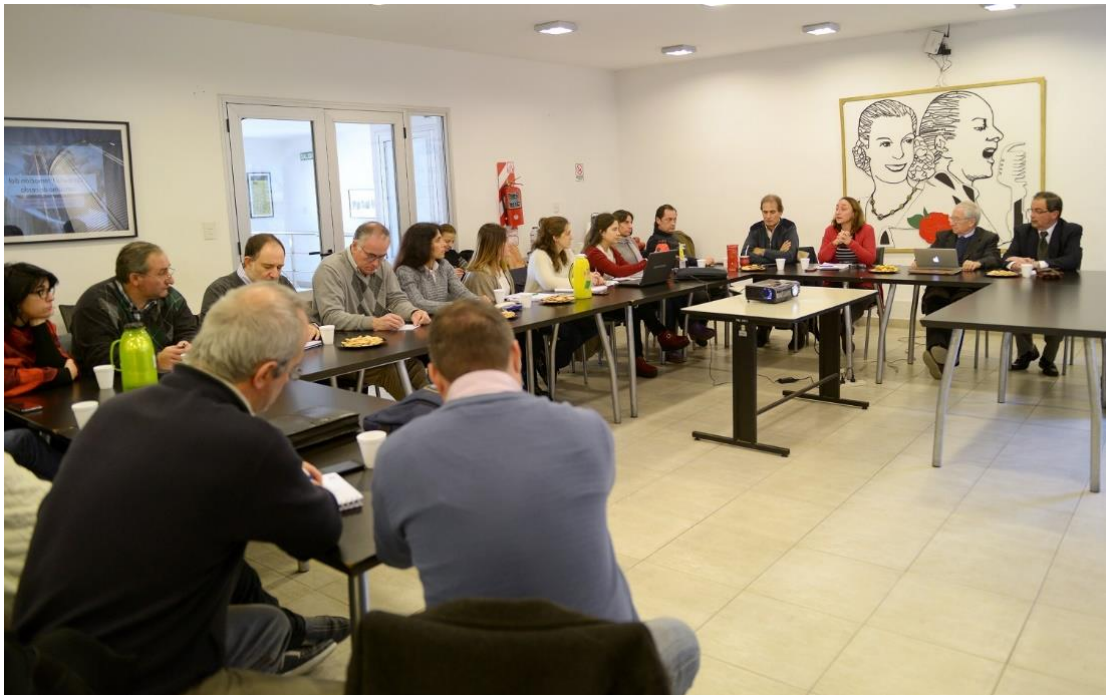
Foto 2: Reunión Sub Mesa Promoción del Consumo de Carne Porcina- 10 de junio